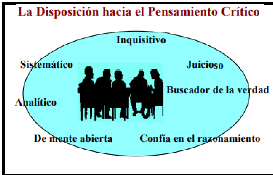
Figura2: Disposición hacia el Pensamiento Crítico (PC).

Facione (2007) plantea que no es suficiente con que una persona tenga o desarrolle habilidades para el pensamiento crítico; se hace necesario contar con una buena actitud a la que denomina disposición hacia el PC. Los expertos identificaron como las principales actitudes que llevan a una disposición hacia el pensamiento crítico, las que se enuncian en la siguiente figura: