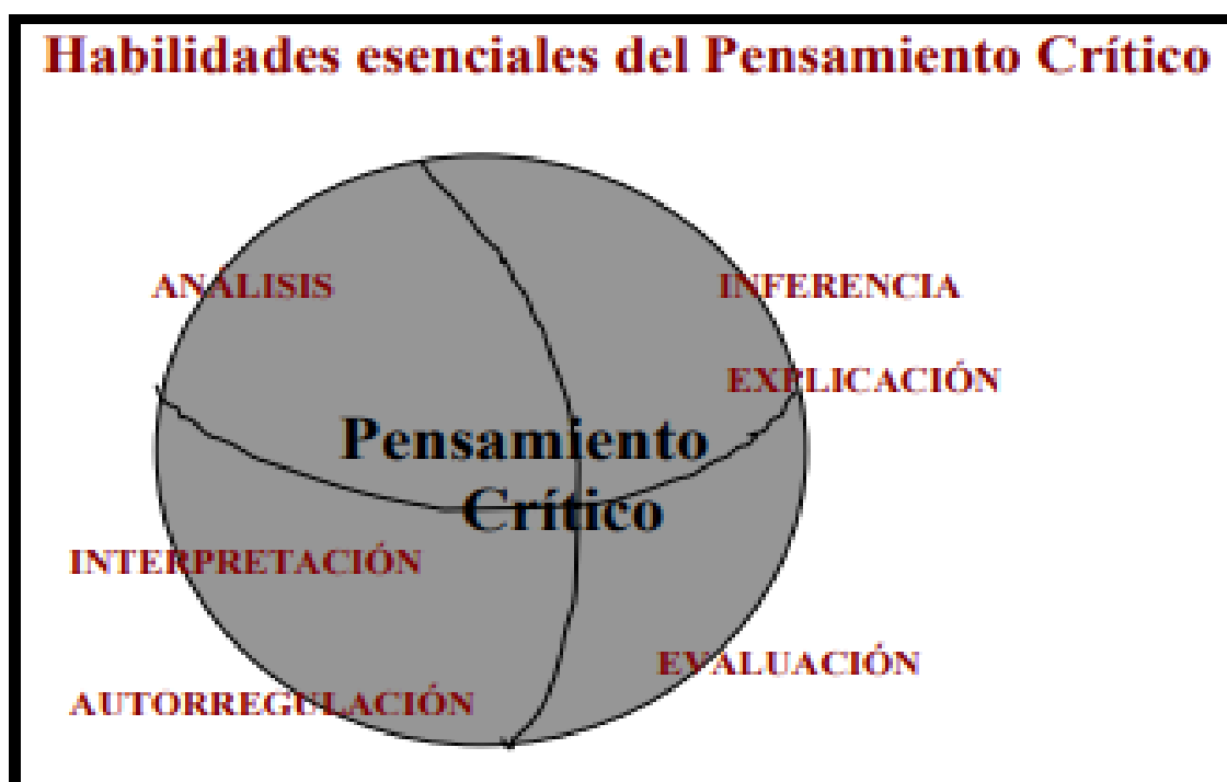
Figura1: Habilidades del Pensamiento Crítico (PC).

Las herramientas para el desarrollo del pensamiento crítico de docentes y directivos fueron construidas y/o adaptadas por el equipo de investigación del IDEP, con base en los planteamientos teóricos de Peter Facione (2007), quien desarrolla su perspectiva conceptual aludiendo al análisis de los aportes de cuarenta y seis expertos de Estados Unidos y Canadá en diferentes disciplinas académicas (humanidades, ciencias, ciencias sociales y educación) quienes fueron reunidos en un panel de expertos, en el marco de un proyecto de investigación para brindar sus aportes sobre pensamiento crítico. El autor utiliza un método inductivo para llegar a plantear una aproximación al concepto, en el que parte de exponer, desde la voz de los expertos, las habilidades fundamentales del pensamiento crítico, las cuales se presentan en la siguiente figura: