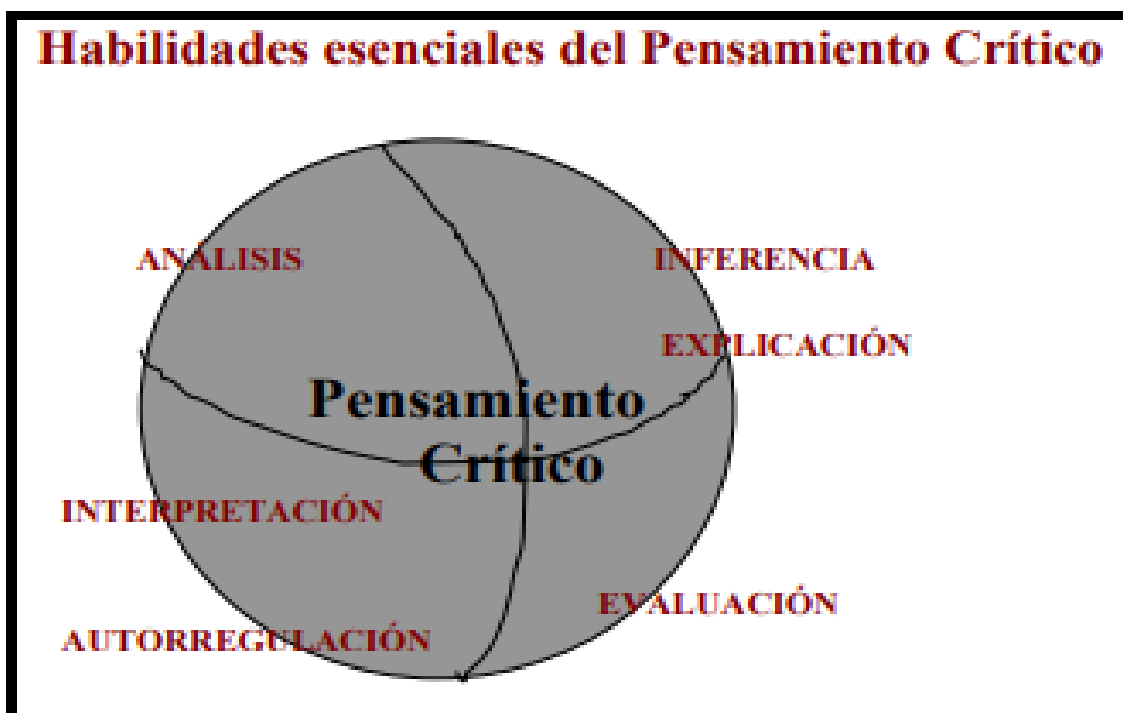
Figura1: Habilidades del Pensamiento Crítico (PC).

Las herramientas para el desarrollo del pensamiento crítico de docentes y directivos fueron construidas y/o adaptadas por el equipo de investigación del IDEP, con base en los planteamientos teóricos de Peter Facione (2007), quien desarrolla su perspectiva conceptual aludiendo al análisis de los aportes de cuarenta y seis expertos de Estados Unidos y Canadá en diferentes disciplinas académicas (humanidades, ciencias, ciencias sociales y educación) quienes fueron reunidos en un panel de expertos, en el marco de un proyecto de investigación para brindar sus aportes sobre pensamiento crítico. El autor utiliza un método inductivo para llegar a plantear una aproximación al concepto, en el que parte de exponer, desde la voz de los expertos, las habilidades fundamentales del pensamiento crítico, las cuales se presentan en la siguiente figura: