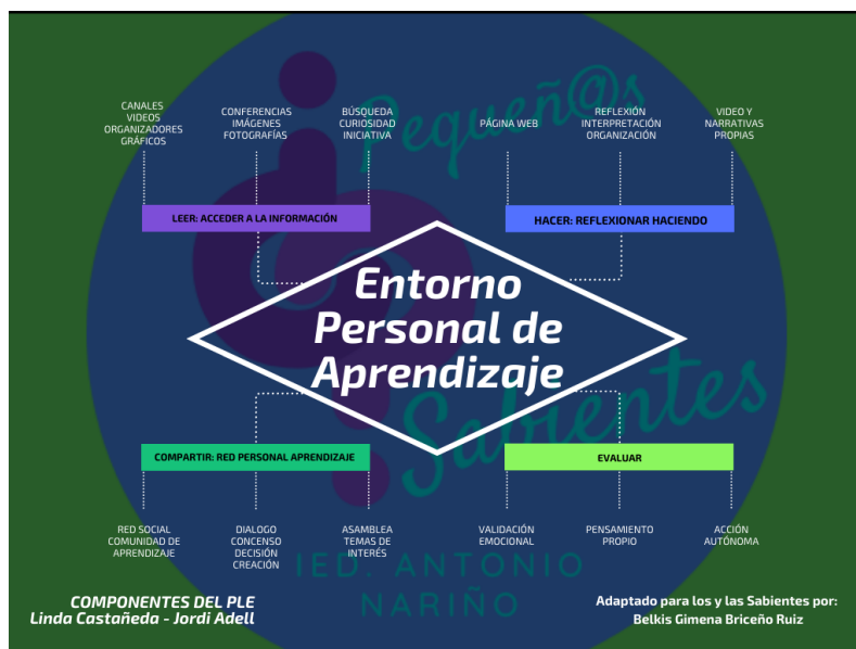
Ilustración No.11. Entorno personal de aprendizaje adaptado.