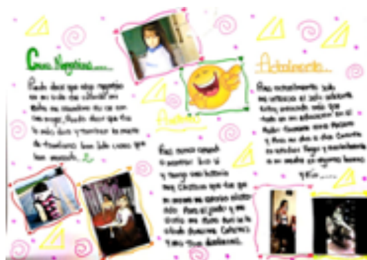
Taller “Mi historia de vida”. Estudiante de 1002 JT, IED Nuevo San Andrés de los Altos, 2020.

Se solicita a los estudiantes que traigan materiales para la elaboración de un cartel (cartulina, marcadores, tijeras, colbón, etc.) relacionado con la historia de vida.